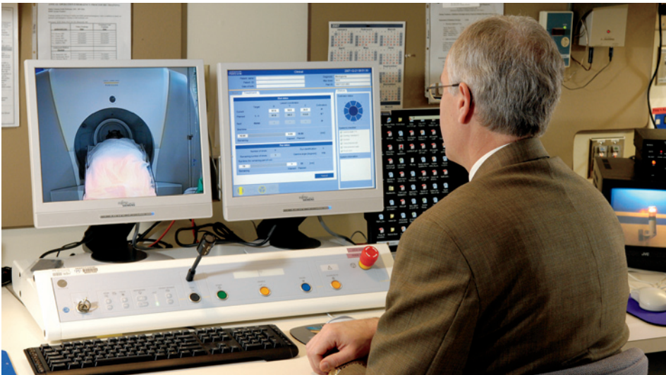
في مركز مايوكلينيك لسكين جاما™، يستعمل الأطباء الكمبيوتر لتخطيط أشعة جاما والسيطرة على آلة سكين جاما™ بحيث تتناسب جرعة الأشعاع مع الهدف المطلوب

تستخدم مايوكلينيك أحدث الابتكارات التكنولوجية لتصوير وتشخيص أورام الدماغ. وتشمل تصوير الدماغ بالرنين المغناطيسي (إم آر أي)، والرنين المغناطيسي الطيفي (إم آر إس)، التصوير المقطعي المحوسب باصدار الفوتون الاحادي (إس بي إي سي تي)، والتصوير المقطعي بإصدار البوزيترون (بي إي تي) والأشعة المقطعية