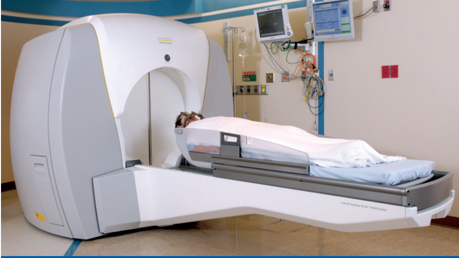
سكين غاما ليكسيل بيرفكسيون وهي جراحة اشعاعية غير جائرة للتوضيح التجسيمي وتناسب مناطق الأورام المحددة بدقة، والتي تستهدف الورم بجرعة عالية من الأشعاع الذي يعطل سلامة الحمض النووي. وبالتالي تكون الأورام غير قادرة على الانقسام والنمو