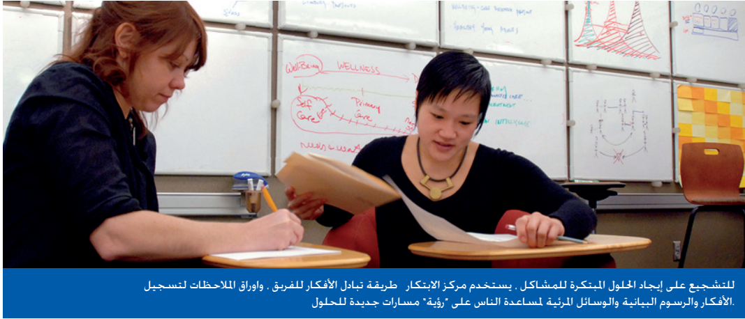
للتشجيع على إيجاد الحلول المبتكرة للمشاكل، يستخدم مركز الابتكار طريقة تبادل الأفكار للفرق. وأوراق الملاحظات لتسجيل الأفكار والرسم البياني والوسائل المرئية لمساعدة الناس على "رؤية" مسارات جديدة للحلول.

الابتكار في مايو كلينيك هي موجة متجددة من الطاقة الخلاقة تسعى الى النشاط. انه عن اكتشاف وتطبيق وسائل جديدة لتوفير رعاية صحية أفضل. كما قال نيكولاس لاروسو، أم. دي. المدير الطبي لمركز الابتكار الجديد لمايو كلينيك في مينيسوتا. "إن المهمة الأساسية للمركز هي تحويل كيفية ممارسة وتقديم الرعاية الصحية".